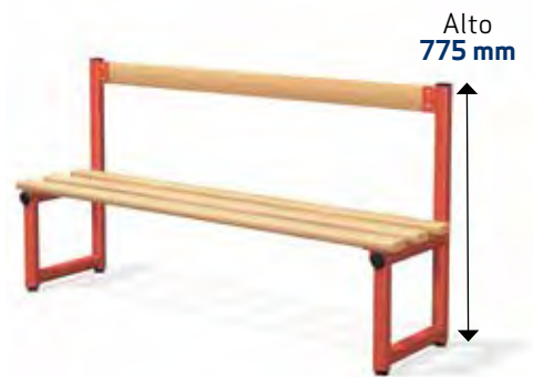
▲ Sencillo con respaldo